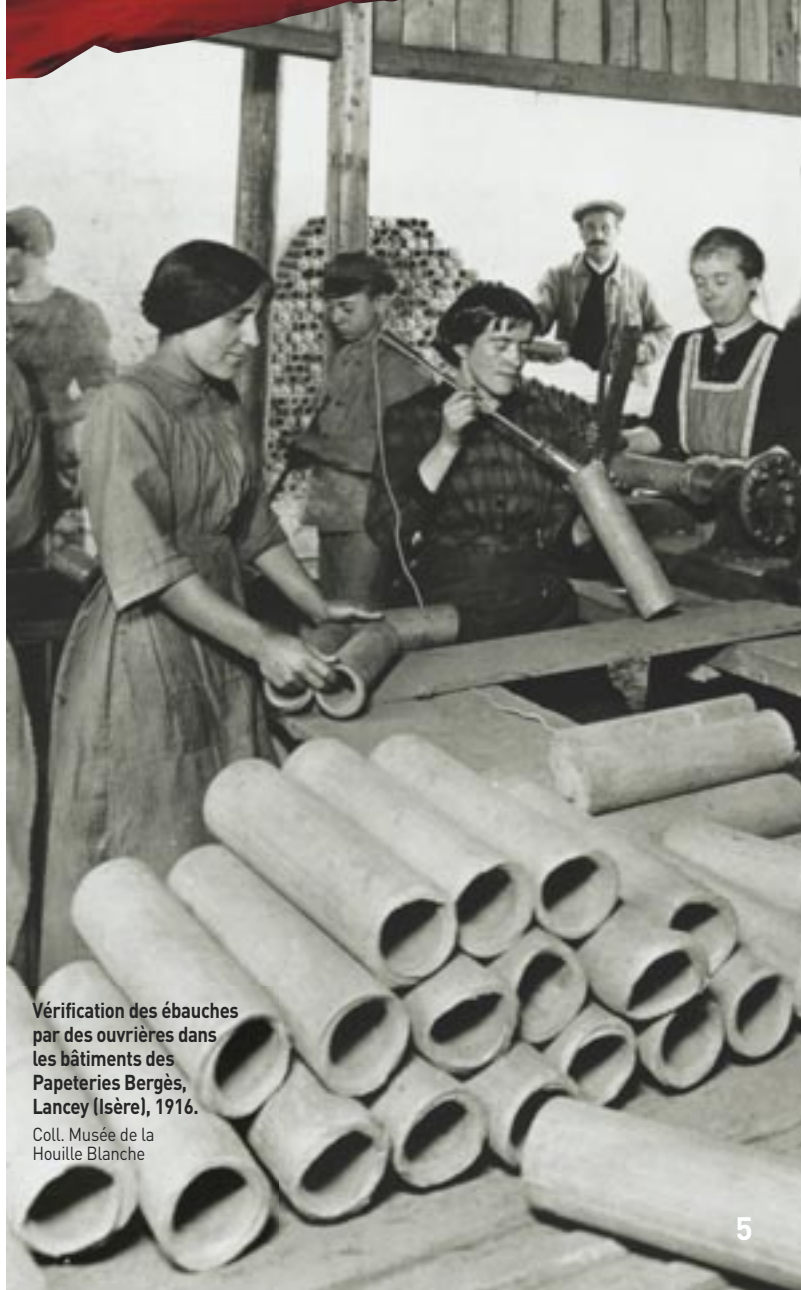
Vérification des ébauches par des ouvrières dans les bâtiments des Papeteries Bergès, Lancey (Isère), 1916.