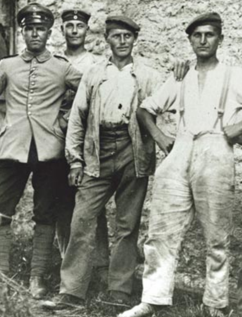
Militaires et prisonniers allemands employés à la construction de la ligne de chemin de fer de la Mure, Saint-Pierre-de-Méaroz (Isère), 1915.